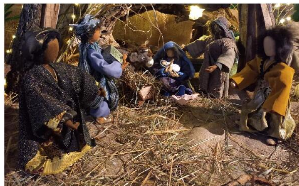
À l'église de Jettingen, des personnages bibliques étaient installés sous un abri confectionné à partir d'un tronc d'arbre.

Changement de décor à la chapelle Saint-Brice de Hausgauen, où une grande étable éphémère a été aménagée pour accueillir pour la première fois une crèche. Elle est composée de sept statues, entièrement renouées, de près