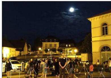
Selon l'oculaire que l'on choisissait, la lune était vraiment très proche...

Pour rassasier les danseurs, il y aura de quoi faire avec deux menus (demi-coquelet, frites, salade, dessert, café ; côte de porc, frites, salade, dessert, café) ou les traditionnels sandwichs merguez ou saucisse blanche.