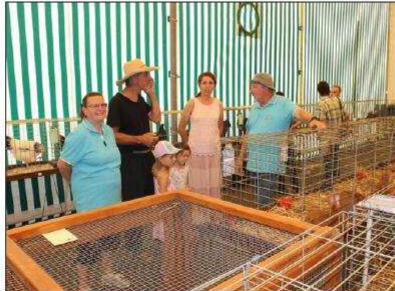
Petits et grands ont pu en apprendre un peu plus sur les différents animaux qui composent une basse-cour.

Fort de quarantaine de membres, l'association présidée par Eugène Stoecklin a exposé une soixantaine de lapins de toutes races, une dizaine de volières avec des volailles et des pigeons blancs de toute beauté. Quelques lapines, accompagnées de leurs portées de lapereaux qui ont fait la joie des visiteurs, étaient également à découvrir dans leurs grandes cages.