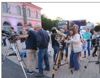
Beaucoup de monde pour observer la lune.