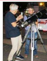
Les membres d'AstroAspach ont informé et conseillé le grand public.

Denis, du club AstroAspach, explique : « Il y a quelques milliards d'années, alors que la terre n'était encore que magma, une violente collision due à une météorite s'est produite sur notre planète. Suite à ce cataclysme, des tonnes de matière ont été projetées dans l'espace et ces roches se sont mises en orbite autour de la terre. Peu à peu, elles se sont agrégées et ont formé un seul et unique satellite : la lune. »