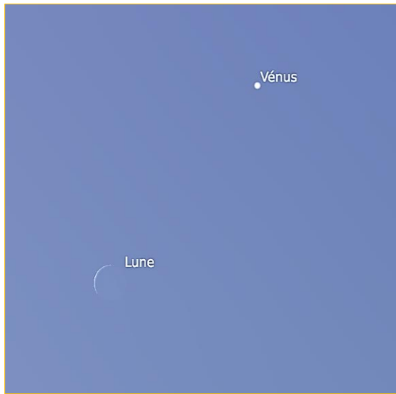
La Lune et Vénus, mardi le 02 avril à 11h 38 au Sud