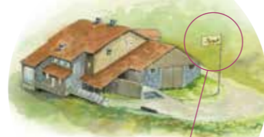
Le drapeau levé signale l'ouverture du bâtiment.

OUVERTURE de 10h à 18h tous les jours de juillet à septembre & tous les week-ends du 15 mai au 30 juin et du 1 er au 15 octobre. En dehors de cette période, téléphonez au 03 89 82 20 12.