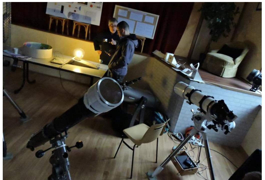
L'exposition de télescope permettait aussi de les essayer, en visionnant une petite planète terre accrochée au plafond de la salle