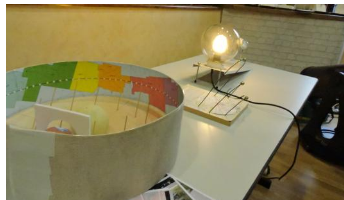
Plusieurs maquettes ont été exposées, notamment celle du cycle soleil - terre - lune.