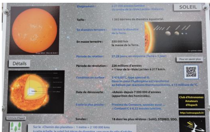
L'un des panneaux du chemin des planètes.